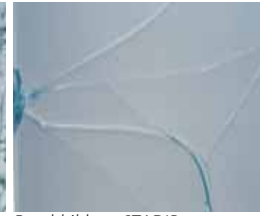
Bruchbild SGG STADIP