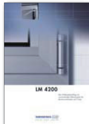
LM 4200 Der Drehkippschlag mit vormontiertem Klemmsystem für Aluminium-Fenster und -Türen