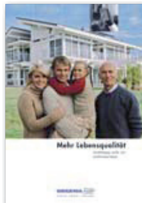
Mehr Lebensqualität Unabhängig, sicher und komfortabel leben