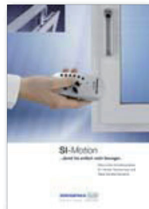
Si-Motion Damit Sie einfach mehr bewegen