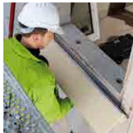
Abb. 6: Drücken Sie die Zarge sorgfältig an das Mauerwerk und richten Sie diese aus.