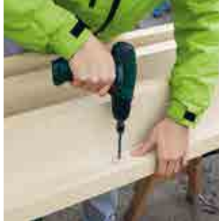
Abb. 2: Bohren Sie die Löcher für die Sicherungsschrauben vor.