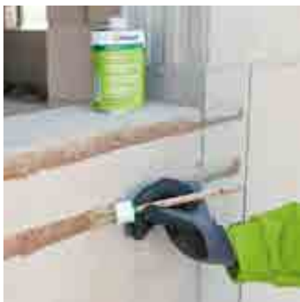
Abb. 4: Reinigen Sie auch das Mauerwerk entsprechend und primern Sie es.