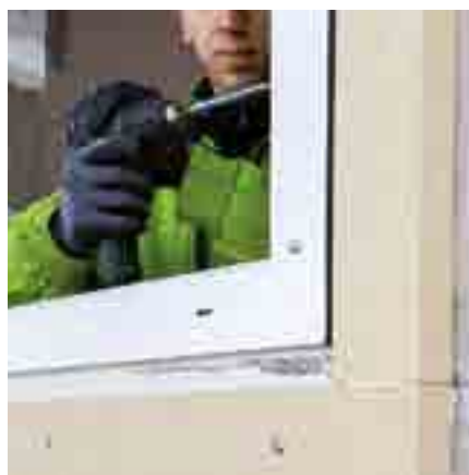
Abb. 8: Befestigen Sie das Fenster mit handelsüblichen Rahmenschrauben und dichten Sie es mit TP652 illmod trioplex+ ab.