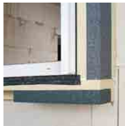
Abb. 9: Verkleben Sie unter der Außenfensterbank eine ME503 TwinAktiv VZ Folie gegen drückendes Wasser. Bei Bedarf können die Zargen mit dem passenden PR008 Dämmkeil ergänzt werden.