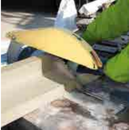
Abb. 1: Schneiden Sie die Zargen zu.