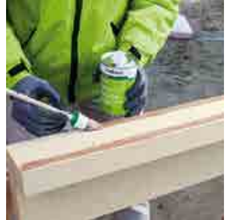
Abb. 3: Reinigen Sie alle Klebeflächen und behandeln Sie diese mit illbruck AT140 Primer vor.