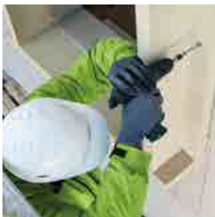
Abb. 7: Sichern Sie alle Zargen mit Rahmenschrauben, um ein Abrutschen zu verhindern.