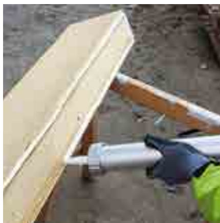
Abb. 5: Tragen Sie den SP340 Soforthaft-Kleber in zwei Strängen auf die Zargen auf.